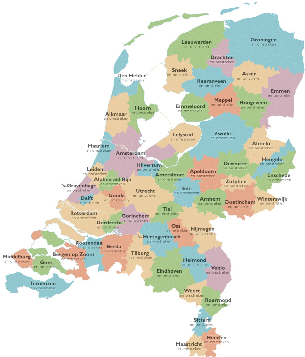
Figuur 3 Het aantal inwoners (op 1 januari 2014) binnen het grondgebied van de beoogde 57 nieuwe gemeenten van Nederland